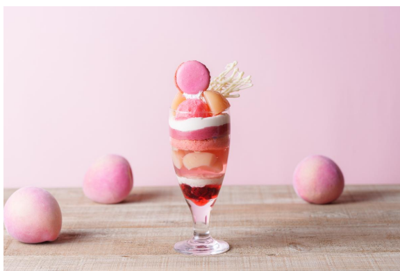
【画像】とろける桃のパフェ（フルサイズ）

サイドメニュー：トリュフとパルミジャーノチーズ香るポテトフライ&コーヒーセット 1,400円（税込み）